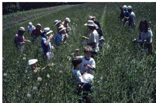
Moltiplicazione e raccolta di fiori selvatici nella Svizzera orientale

In Svizzera numerosi produttori privati dispongono di assortimenti che soddisfano ampiamente queste raccomandazioni. Gli indirizzi dei fornitori possono essere richiesti all'Infocentro piante selvatiche o al segretariato della CPS.