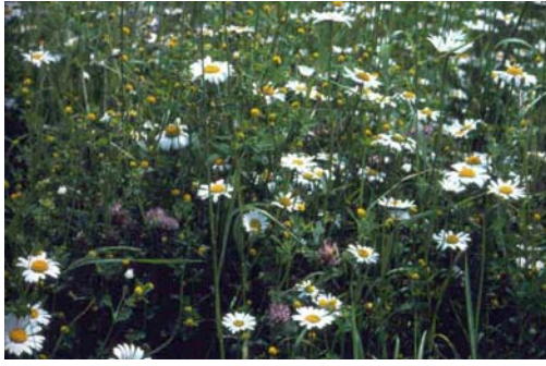
Prato a Avena altissima, seminato in pianura