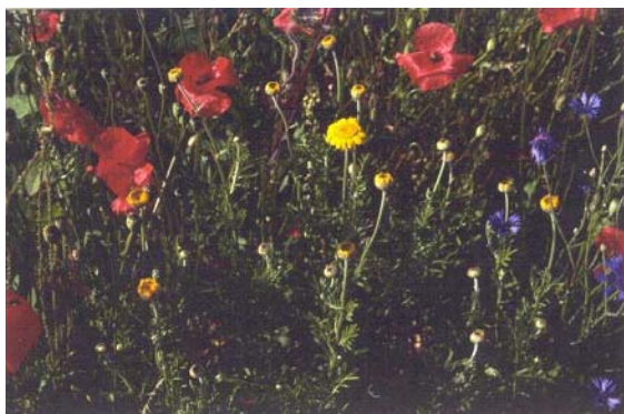
Maggese fiorito di 1 anno (Avully)

Esempi di maggesi fioriti nel Cantone di Ginevra: