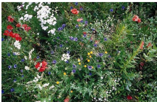
Ecoflor a giugno dell'anno di semina

Il commercio propone miscele che corrispondono alle raccomandazioni della CPS (p. es. Ecoflor , sviluppata dall'Alta scuola svizzera di agronomia di Zollikofen e dall'Università di Berna in collaborazione con Pro Natura e Eric Schweizer Sementi SA, con il marchio Pro Natura ).