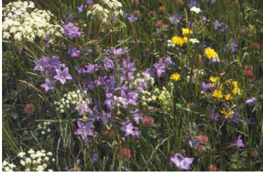
Esempio di superficie di compensazione ecologica: prato a Avena altissima ricco di specie

Le superficie di compensazione ecologica possono assumere un grande valore per la salvaguardia della diversità biologica, a condizione che siano create in un ambiente adeguato, che possano essere messe in rete con altri ambienti esistenti o da creare, e che siano durature.