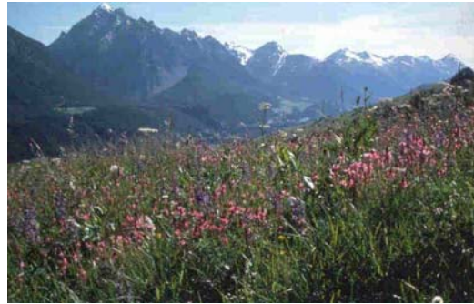
Prato a Gramigna bionda in montagna