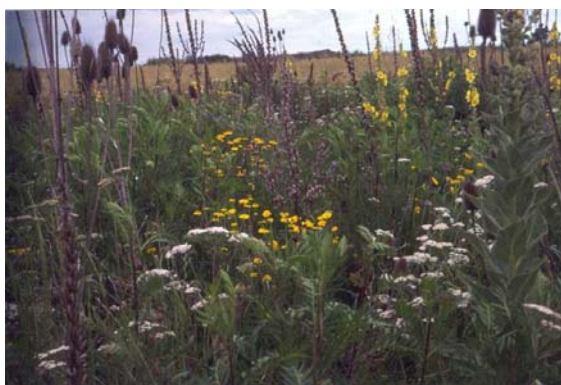
Maggese fiorito di 3 anni (Avully)