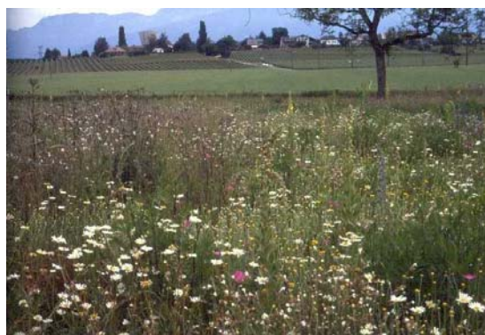
Maggese fiorito di 2 anni (Collex-Bossy)