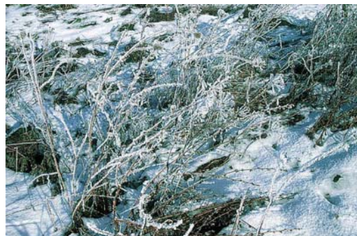
Ecoflor in inverno offre rifugio e cibo a numerosi insetti, piccoli mammiferi e uccelli