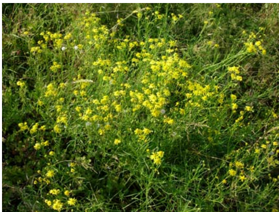
Senecio inaequidens , autoroute Lausanne - Genève