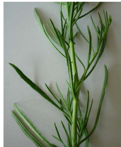
feuilles étroites, entières, bord de la feuille enroulé vers le bas