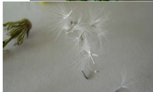
fruit avec pappus = aigrette de soies blanches