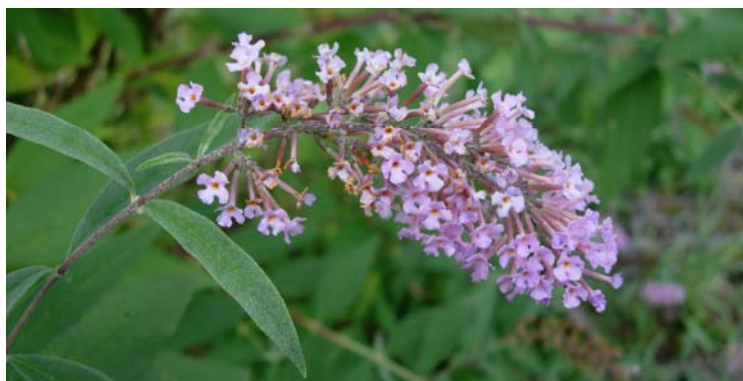
Buddleja davidii – scheda CPS - 2009

Kowarik, I., 2003, Biologische Invasionen: Neophyten und Neozoen in Mitteleuropa , Ulmer Verlag, Stuttgart. Muller S., 2004, Plantes invasives en France – état des connaissances et propositions d'actions , Publications scientifiques du MNHN, Paris.