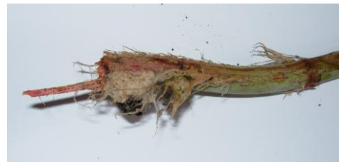
bout de tige coupé ayant développé des racines en quelques jours