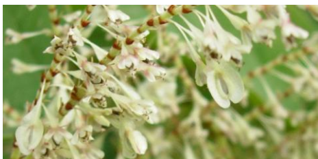
Fruits ailés typiques pour la famille