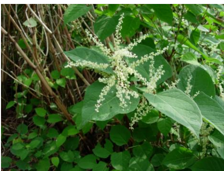
inflorescence ♀ de la renouée du Japon