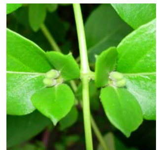
Boutons floraux à l'aisselle des feuilles opposées