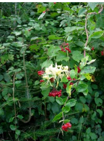
Le chèvrefeuille du Japon en forêt sur un alisier.

Zäch R., 2005, Ökologie und Ausbreitung von Neophyten auf dem Monte Caslano im Südtessin , Diplomarbeit, Geobotanisches Institut ETHZ, http://e-collection.ethbib.ethz.ch/ecol-pool/dipl/dipl_178.pdf