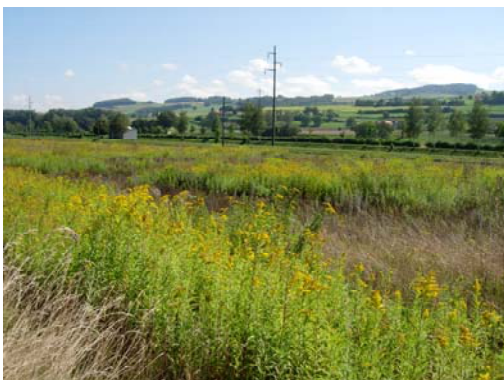
Buntbrache im Broyetal