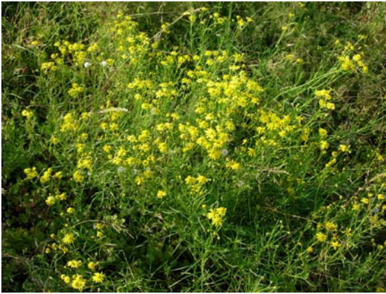
Bestand Senecio inaequidens , Autobahn Lausanne-Genf