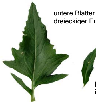
untere Blätter fiederteilig, bis 40 cm lang, dreieckiger Endabschnitt