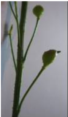
Schief eiförmige Frucht mit ungleichen Höckern

Kowarik I., 2003, Biologische Invasionen - Neophyten und Neozoen in Mitteleuropa , Ulmer Verlag, Stuttgart.